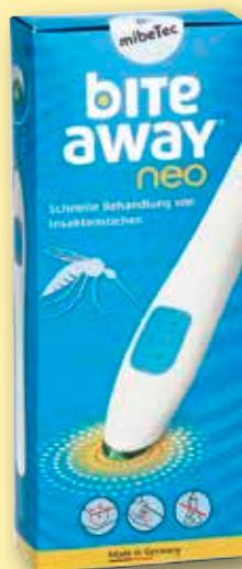
bite away® neo Stichheiler 1 Stück