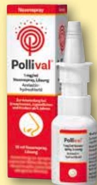
Pollival® 1 mg/ml Nasenspray Lösung 10 ml