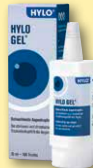
HYLO® Gel Augentropfen 10 ml