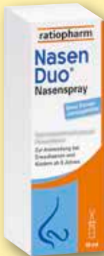
ratiopharm Nasen Duo® Nasenspray 10 ml