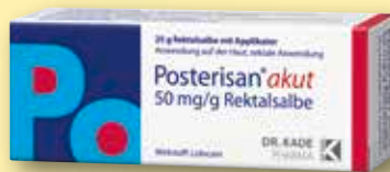
Posterisan® akut 50 mg/g Rektalsalbe 25 g