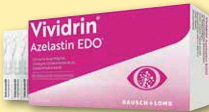
Vividrin® Azelastin EDO® 0,5 mg/ml Augentropfen Lösung, 20 Einzeldosen à 0,6 ml

Man spürt ihn meist nicht und er löst keine unmittelbaren Beschwerden aus - doch dann schlägt er zu: Die Rede ist vom Bluthochdruck, der häufig in Schlaganfälle, Herzinfarkte oder Demenz mündet. In der aktuellen Ausgabe von MEIN TAG erfahren Sie, wie Sie einem zu hohen Blutdruck entgegenwirken können. Außerdem finden Sie in unserem Magazin neben vielen News und Ratschlägen rund um Ihre Gesundheit auch Wissenswertes über das Kulturgut Butterbrot und warum Langeweile wichtig für die Entwicklung von Kindern ist. Wir wünschen einen sonnigen Mai.