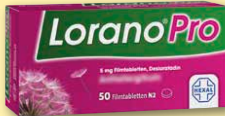
Lorano® Pro 5 mg Filmtabletten 50 Stück